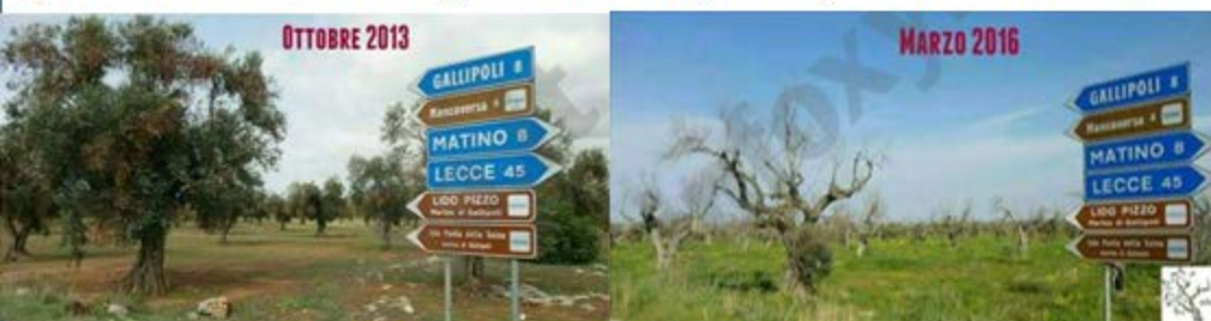
Philaenus spumarius L. "Sputacchina media"

Non essendo stato ancora trovato ed ufficialmente registrato alcun metodo/prodotto per curare le piante affette da Xylella fastidiosa, il controllo dei vettori e l'eliminazione delle piante infette sono attualmente gli unici mezzi a disposizione per limitarne la diffusione.